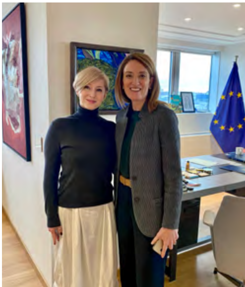
S eurokomisařkou Stellou Kyriakides.

Setkávání a debatování s politiky a odborníky jak na úrovni Česka, tak Evropy a vedení Evropské unie. Například: